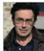
Rémi Mauger Réalisateur